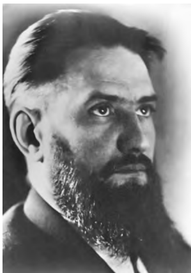
Игорь Васильевич Курчатов

пытания 29 августа 1949 г., когда была взорвана первая советская атомная бомба.