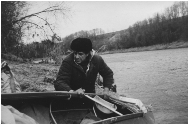
В походе (1971).