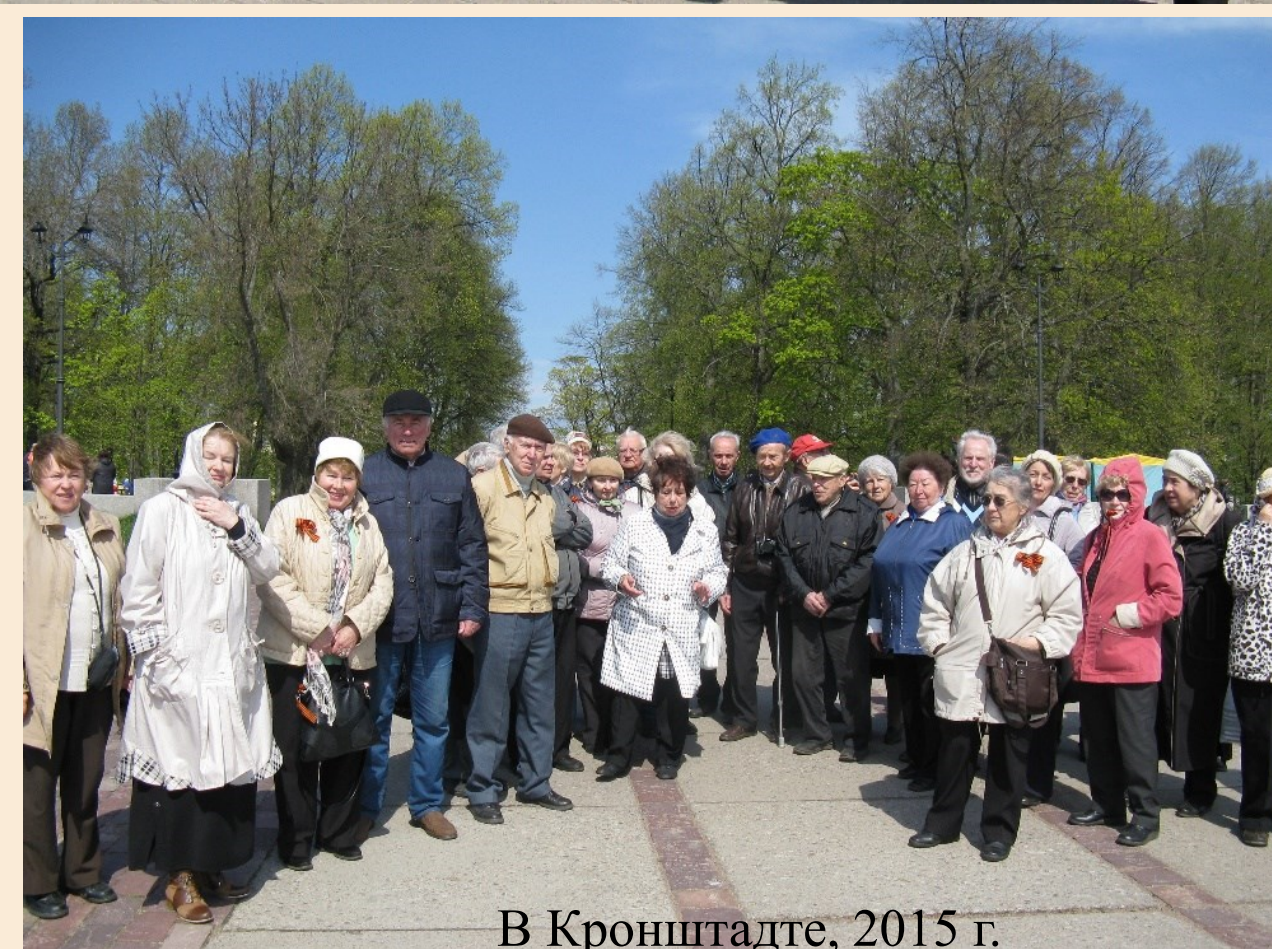
В Кронштадте, 2015 г.