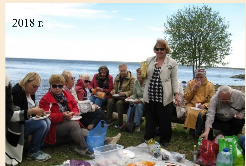
Поездка с ветеранами ФТИ в крепость Орешек, 2018 г.