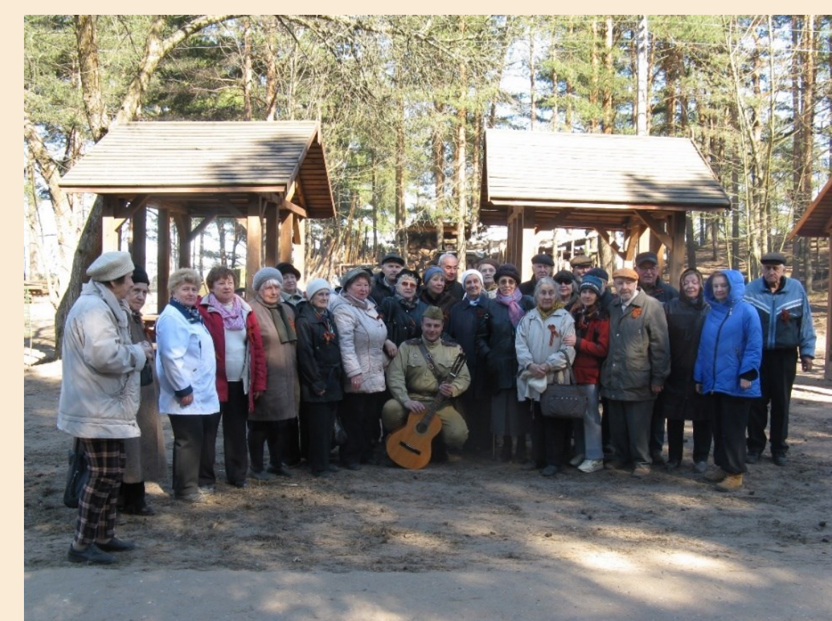
Сестрорецкий рубез, 2017 г.