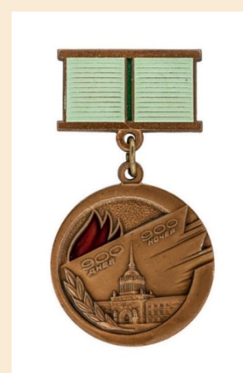
Знак "Жителю блокадного Ленинграда"

лаборатория космических лучей патентно-лицензионная служба лаборатория экспериментальной астрофизики лаборатория физики элементарных структур на поверхности лаборатория космических лучей лаборатория физической газодинамики лаборатория динамики материалов лаборатория физики редкоземельных полупроводников лаборатория физики профилированных кристаллов лаборатория мощных полупроводниковых приборов лаборатория физики профилированных кристаллов лаборатория квантовой электроники сектор теории полупроводников и диэлектриков лаборатория спектроскопии твердого тела