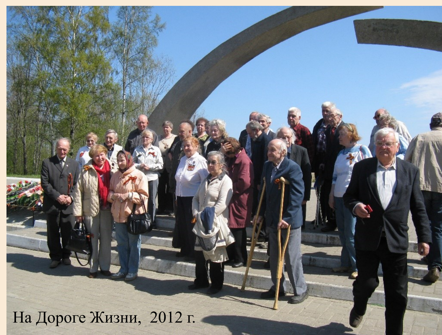
На Дороге Жизни, 2012 г.