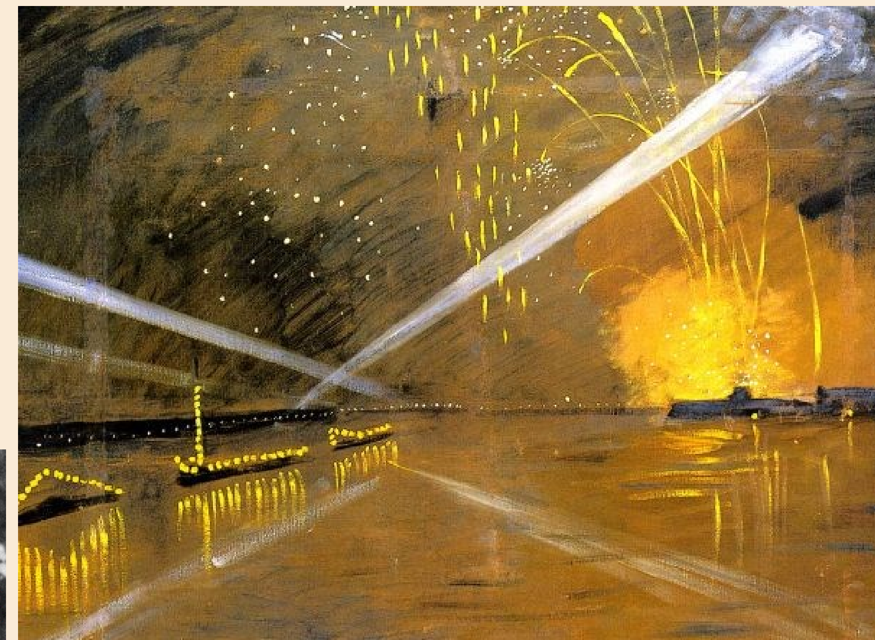
А.П. Остроумова-Лебедева. Салют на Неве, 27 января 1944 г.

27 января 1944 года ленинградцы впервые услышали в своём городе победный салют.