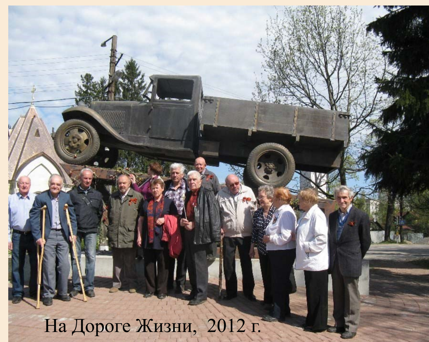
На Дороге Жизни, 2012 г.

Администрация и Профсоюзный комитет Физтеха проявляют заботу о ветеранах, организуя ежегодные автобусные поездки по памятным местам, связанным с днями Великой Отечественной войны, прорывом и снятием блокады города-героя Ленинграда.