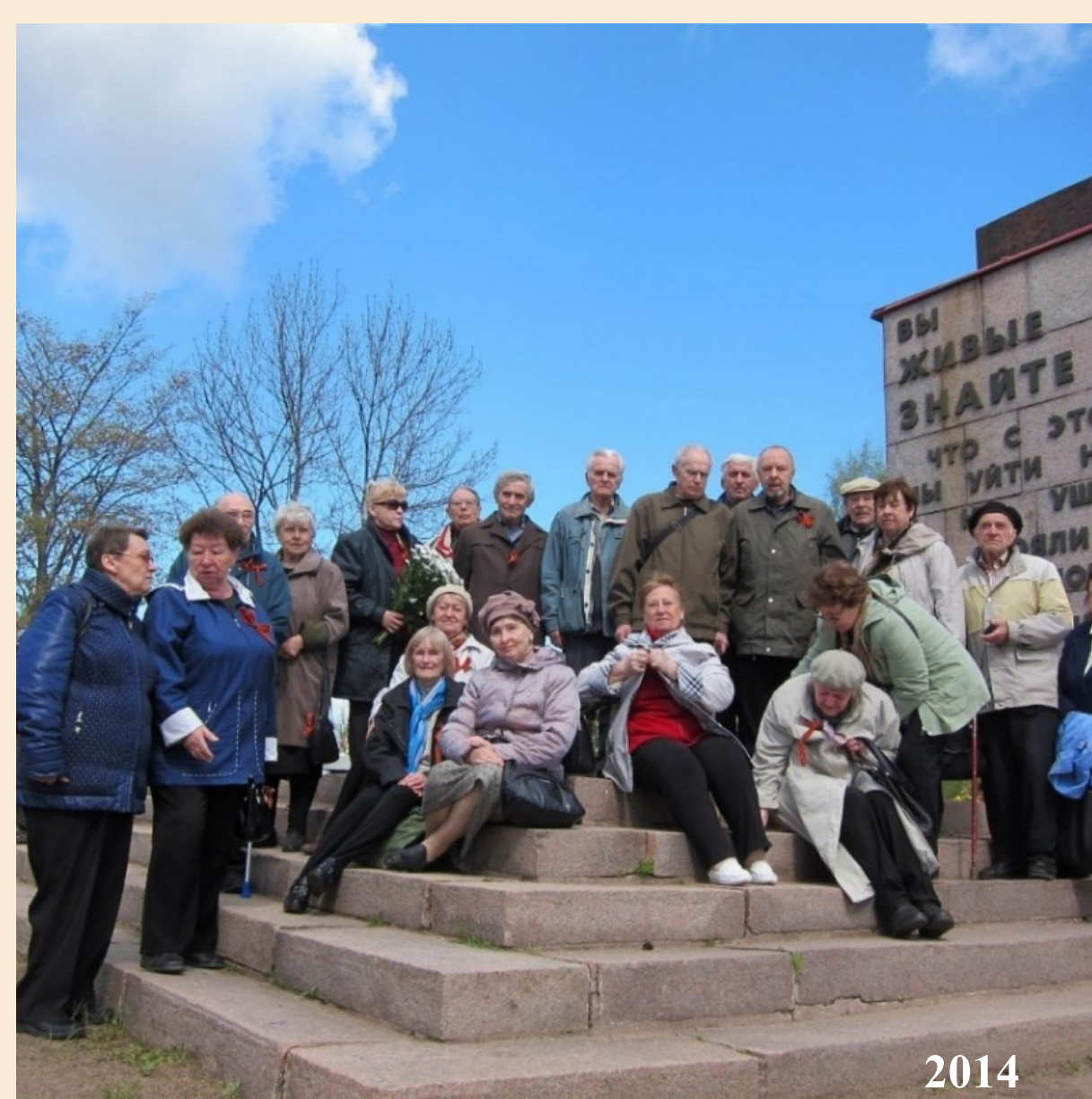
На Невском пятачке у памятника «Рубежный камень» (установлен в 1971 г. по проекту Энгеля Насибулина)